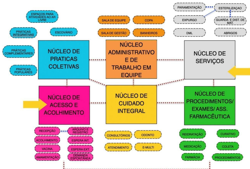
Figura 1: Diagrama de Massas